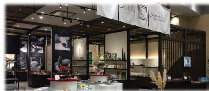
合同会社ティ・オー・クル 国内店舗