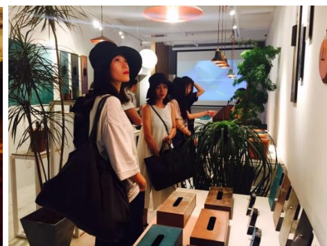
△TASTEショップ2階での展示様子