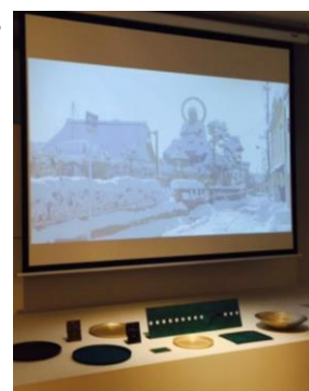
△高岡ビデオ放映中